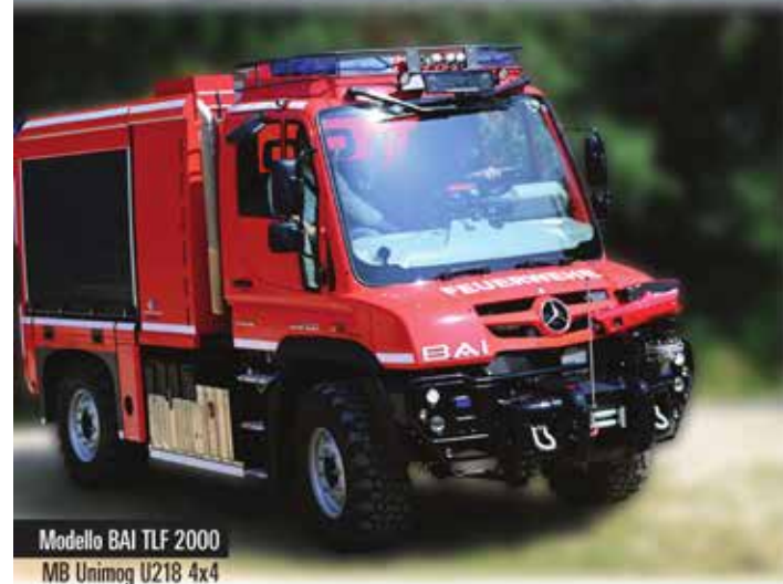
Modello BAI TLF 2000 MB Unimog U218 4x4

Da 30 anni BAI Brescia Antincendi International Srl è una delle più grandi società italiane specializzata nella progettazione, costruzione e commercializzazione di un'ampia e tecnologicamente avanzata gamma di veicoli antincendio e di soccorso.