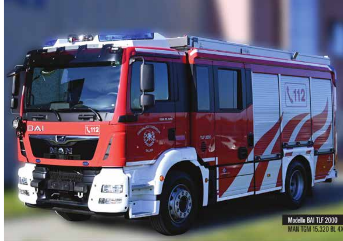
Modello BAI TLF 2000 MAN TGM 15.320 BL 4x4